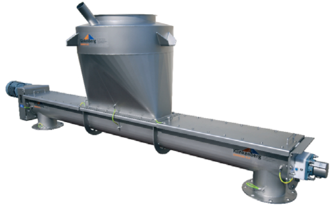
Hopper 1000 liter met doseerschroef. Doseerschroef links en rechts doserend

De KDS van Klinkenberg worden in vele industrieën ingezet. Denk bijvoorbeeld aan de voeding-, chemie, farmacie, veevoeder- en kunststof