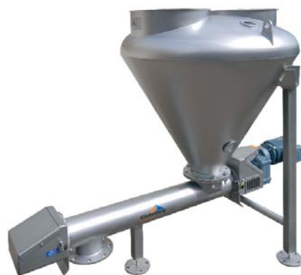
Doseren van suiker cacao en zetmeel volledig sanitair uitgevoerd