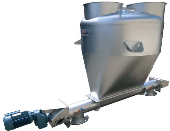
1500 liter hopper met doseerschroef links of rechts doserend