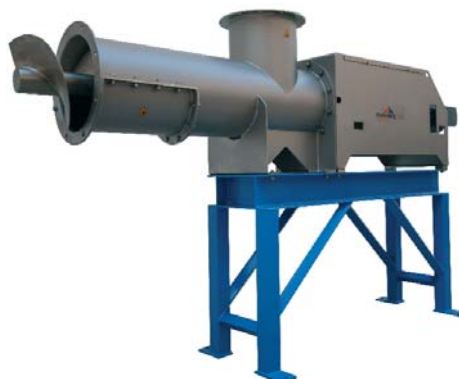
Doseerschroef enkelzijdig gelagerd. Dosering van 80m 3 /uur naar ringdroger