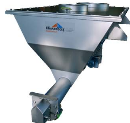
Bufferen en uitdoseren vanuit 3 m 3 hopper