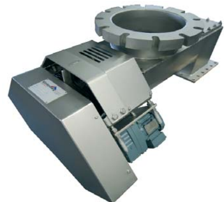
Massastroom doseren van houtpallets uit torrefactie proces. Volledig ontwikkeld om een massastroomproces te garanderen.